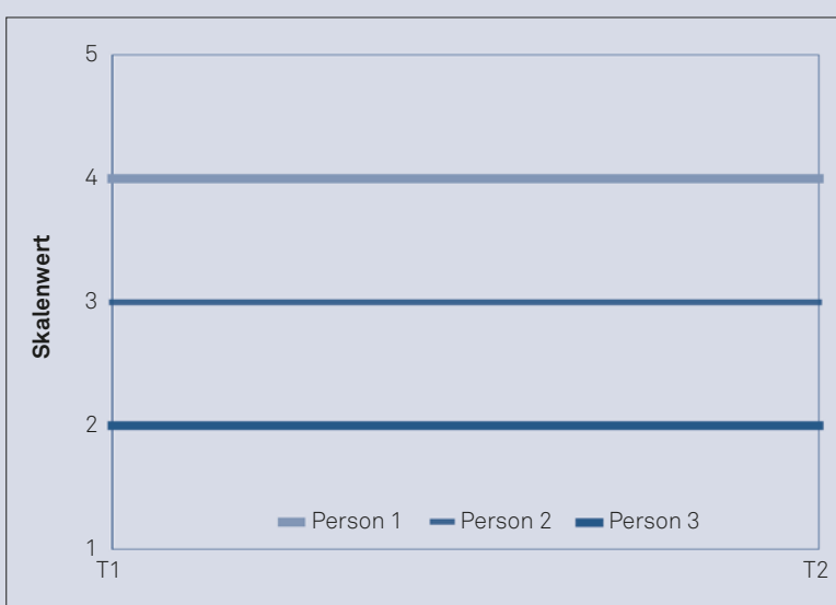
Abbildung 1a: Das Merkmal weist absolute Stabilität (zugleich Niveaustabilität und korrelative Stabilität) auf.