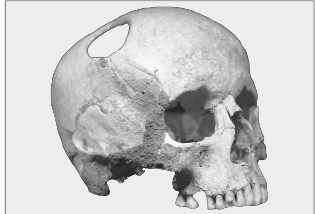
Abbildung 2: Trepanation

2000). Einige Funde von Schädeln mit Spuren einer Trepanation datieren auf ca. 7000 v. Chr. und Hinweise auf neues Knochenwachstum nach einer Trepanation deuten darauf hin, dass einige der Patienten diese Behandlung sogar überlebt haben (Lillie, 1998).