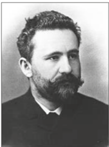
Emil Kraepelin (1856–1926)

Der hirnpathologische Ansatz am Beginn der wissenschaftlichen Psychiatrie